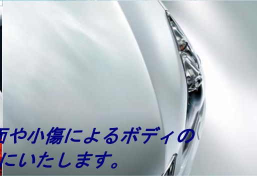
●コーティングイメージ図